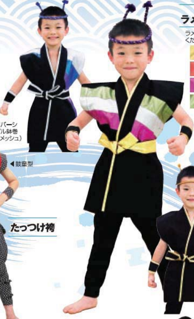
はんでん ラメ半天 B