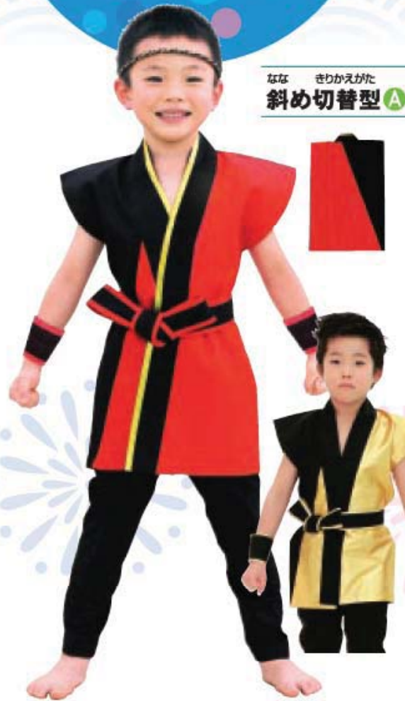
なな きりかえがた 斜め切替型 A