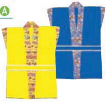
きりかえはんでん 切替半天 A