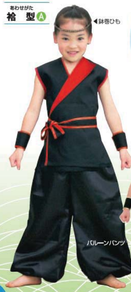
あわせがた 袷型 A