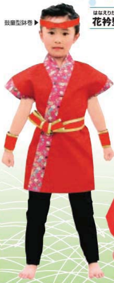
はなえりがた 花衿型 A