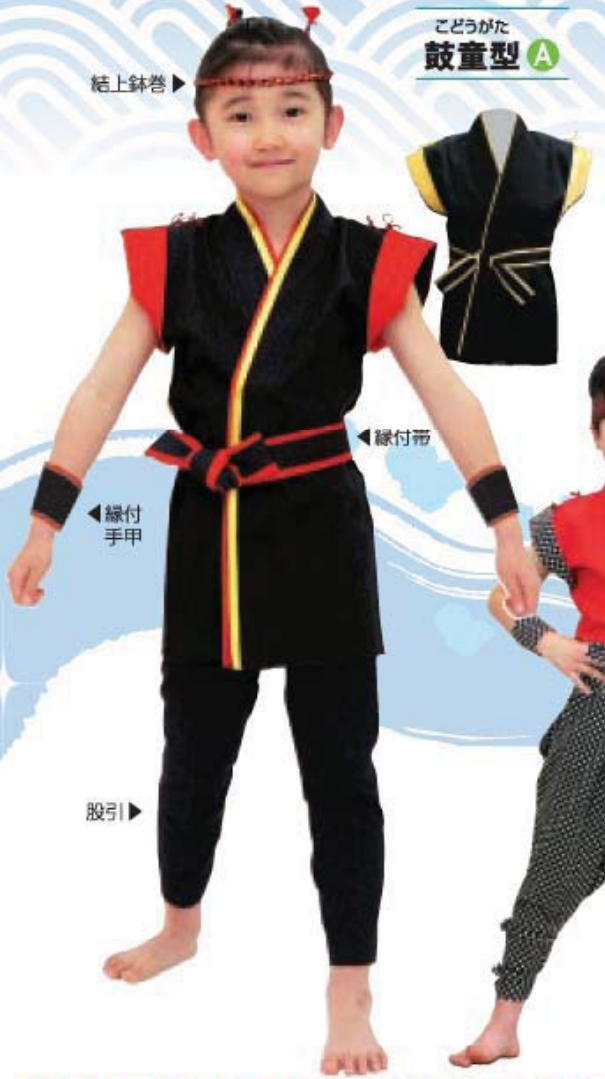
こどうがた 鼓童型 A