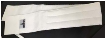
白色ストラップ付