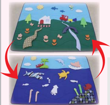
リバーシブルマット サイズ約 185×235cm

カラフルなマットを床いっぱいに広げると そこは楽しいイメージの世界！ 先生やお友だちとの会話も弾みます♪