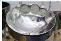
スチールパンは南国の音！

今回は、戦後まもなく日本で製作された幻の「 ミヤカワマリンバ 」を導入いたします。ほかにスチールパンやアंकフルンなど、たくさんの打楽器を使用して、南の島をイメージしたプログラムに仕上げました。