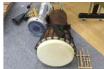
民族楽器の太鼓類