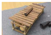
木器も独特なサウンドです